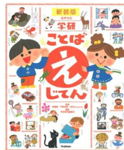
「ことばえじてん」 (学研)

※バランスクッションについては幼稚園、小中学校に貸出可能です。本校にお問い合わせください。