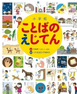
「ことばのえじてん」 (小学館)