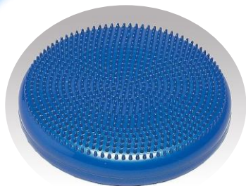
「バランスクッション」