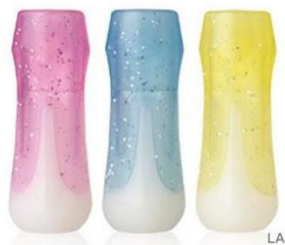
「グミップ」(SONiC) (鉛筆グリップ)