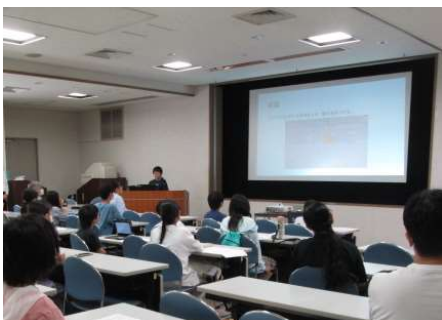
自由研究発表会の様子

※4月上旬から教育センターホームページ ( http://www.sakai.ed.jp/ ) に動画のリンクを掲載します。