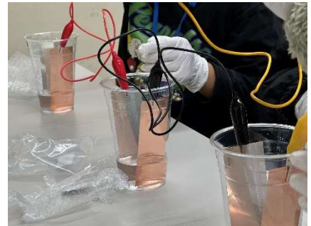
昨年度の科学体験の様子