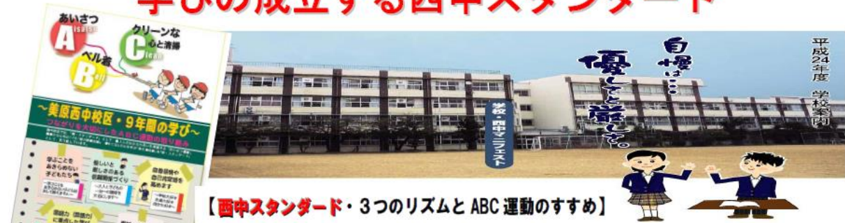
【西中スタンダード・3つのリズムとABC運動のすすめ】