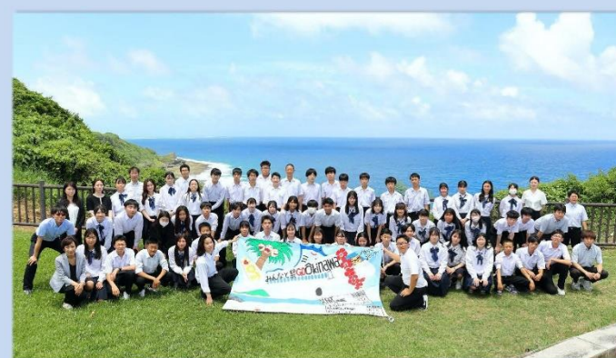
第3学年（52期生）沖縄方面修学旅行 令和7年6月12日(木)～14日(土) 平和学習（平和祈念資料館）マリン体験 奥ら海水浴場 首里城見学 国際通り散策研修