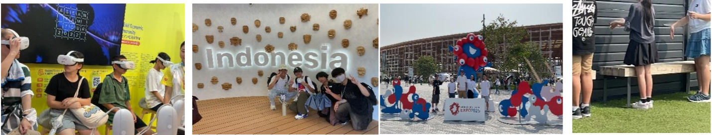
子どもたちが万博会場で撮影した撮影した写真から

1学期を終えるにあたり、子どもたちの頑張りに拍手を送ります。それを象徴することは全校生で訪れた大阪・関西万博での学びです。「集団活動を通して、未来社会をそうぞう(想像・創造)する」「集団活動を通して、多様な国の文化に触れ、多文化共生の土壌を養う」という目標を見事に達成してくれました。特に全校生で入館した「PASONA NATUREVERSE」では食い入るようにiPSミニ心臓を見て仲間と一緒にいのちを考え、医療の進化や未来について学ぶ姿に頼もしさを感じました。また、仲間と共に様々な国のパビリオンを訪れ、他国の文化に触れたことで多様な考えを知り、視野を広げられたことは、その後の振り返りや学校生活に表れています。様々な学びを通して小規模校ならではの絆を築いてくれた子どもたち。これは原中の強みです。仲間と共に学びにおく姿に成長を感じた1学期。この成長が土台となり今後も様々な場面で活躍してくれることを期待します。