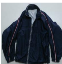
ウィンドブレーカー