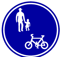
ふつうじてんしゃほどうつうこうか 「普通自転車歩道通行可」 しめ ひょうしき を示す標識

じてんしゃ げんそくしゃどう はし ほどう はし ばあい 自転車は原則車道を走りますが、歩道を走れる場合があります！