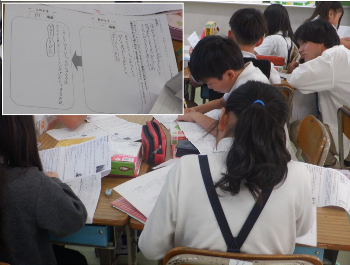
3年 場面を比べて、主人公の気持ちの変化をとらえます