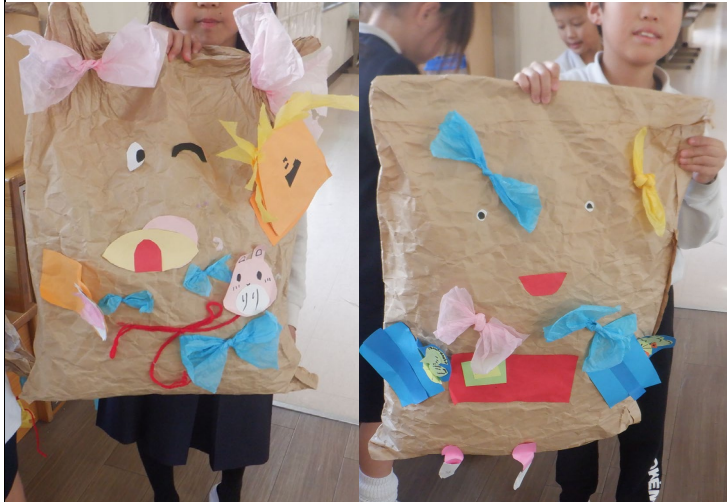
2年 大きな紙袋を使って「友だち」を作りました。