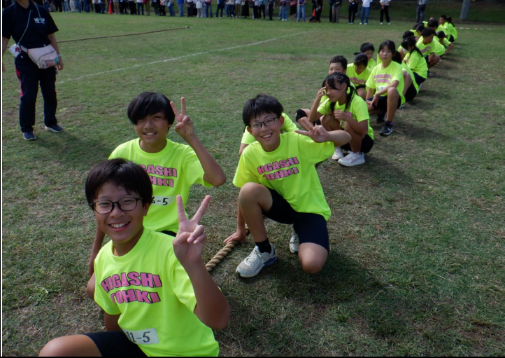
6年 練習の成果を発揮して見事両チーム優勝。おめでとう！