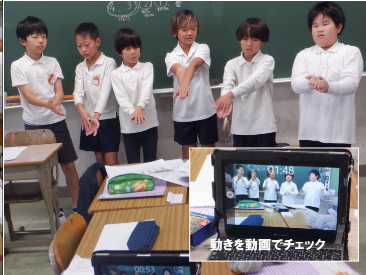
4年 お年寄りが体を動かせるような体操を作っています。