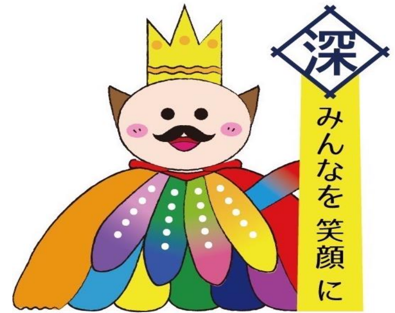
深井小学校 150周年記念キャラクター 笑王(えがおう)

住所 堺市中区深井中町1409 電話番号 072-278-0108 学校ホームページ http://www.sakai.ed.jp/fukai-e/