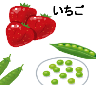
いちご グリーンピース