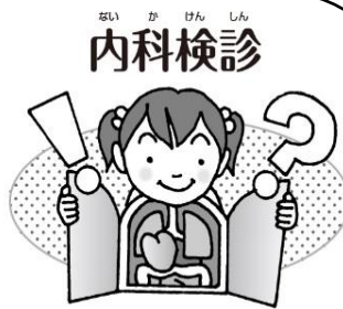
からだに病気や異常はないかな？