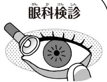
目の病気や異常はないかな？