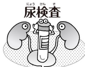
腎臓の病気や 糖尿病の疑いはないかな？