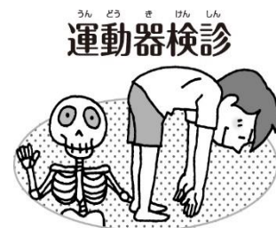
骨や関節などに異常はないかな？