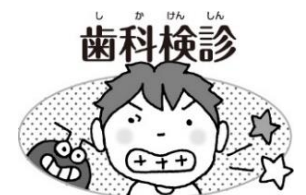
むし歯はないかな？ 歯ぐきやかみ合わせには 異常はないかな？