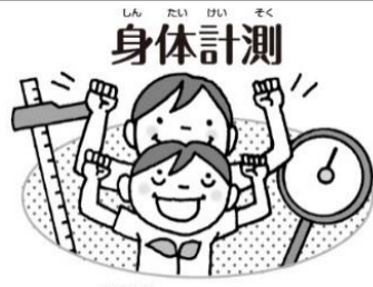
からだの成長のようすがわかります