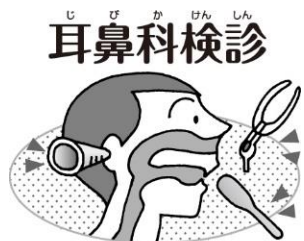
耳・鼻・のどの病気や 異常はないかな？