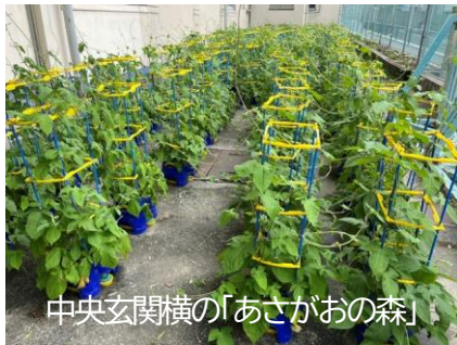
中央玄関横の「あさがおの森」

いよいよ1学期の最終月、7月になりました。今年度は7月の第3月曜日の「海の日」が20日となるため、 7月17日(金) が終業式となります。