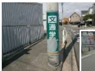
「通学路」電柱巻き看板が損傷している！