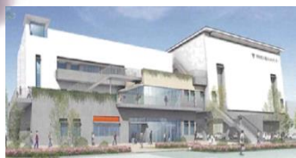
堺市立人権ふれあいセンター