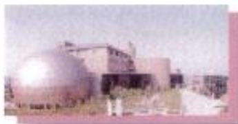
ソフィア・堺 (堺市教育文化センター)