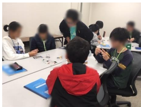
昨年度の科学体験のようす

※クラブ加入申込は、申込用紙を教育センターあてに郵送、又はソフィア・堺 3 階教育センター事務室まで直接持参してください。（ただし土曜～月曜・祝日は除く）