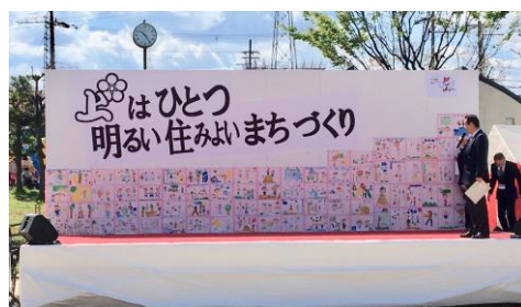
〔 桜まつり 1年生（現2年生）作品紹介 〕