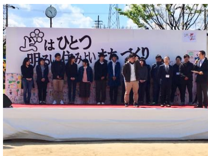
〔 桜まつり 職員紹介 〕